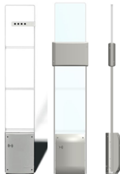
Con contapersone integrato (opzionale)

Sfrutta i principi Active/Active e Passive/Passive